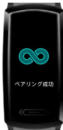
ペアリング通知画面