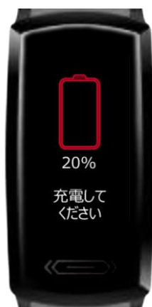
充電不足通知画面